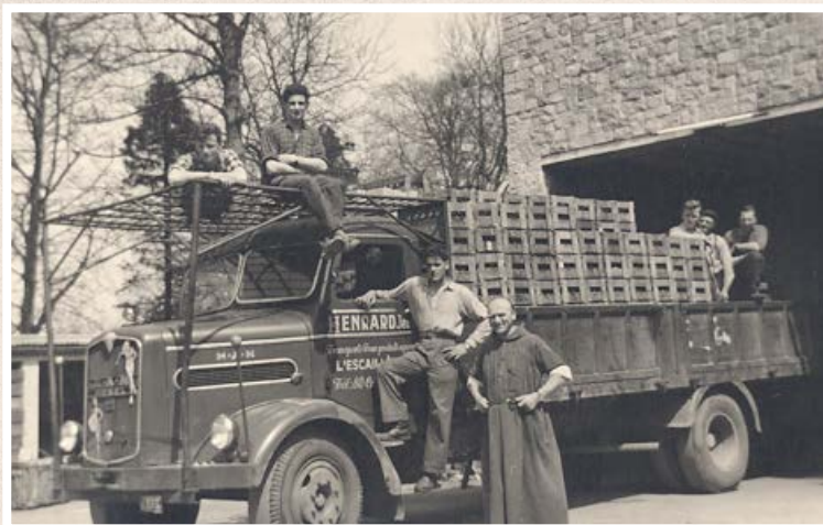
Camion prêt à livrer, mars 1958 Le Père Noël veille...

5x18cl (Rouge, Triple, Bleue, Dorée, 150)..... 13,00 €