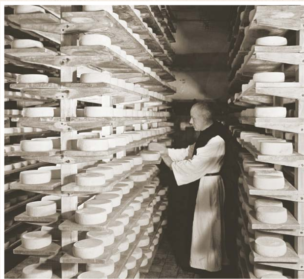
Cave de l'Abbaye de Scourmont